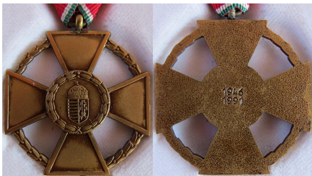
21. – 22. kép - Érdemkereszt katonai tagozat bronz fokozat éremrész két oldala