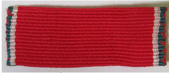
39. kép - Magyar Köztársasági Érdemrend Kiskereszt / Lovagkereszt szalagsávja

A szalagsáv 41 vagy 42 mm széles, 15 vagy 16 mm magas is lehet. Jobb és baloldali szélén zöld, mellette fehér színű sáv, a többi rész vörös.