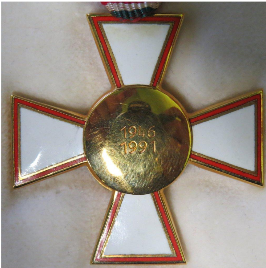
38. kép - Magyar Köztársasági Érdemrend Kiskereszt / Lovagkereszt éremtest hátoldala