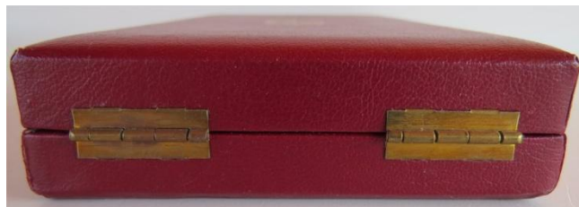
03. kép - a szétnyitáshoz stiftes, fém patentolás a doboz hátulján