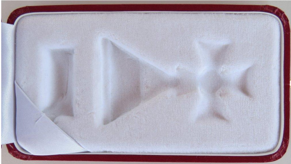
34. kép - Magyar Köztársasági Érdemrend Kiskereszt / Lovagkereszt dobozának belső része, a „fészek”

A kereszttek szárjai 16 mm szélesek, a babérkoszorú külső átmérője 18 mm. A címer 5 mm széles, 10 mm magas. A kereszt tetején a kontraszem befogadó része látható. A kereszt hátoldalán 18 mm arany domborított lap, melyen "1946 1991" évszámok szerepelnek, a karakterek magassága 2 mm, hosszúsága 6 mm.