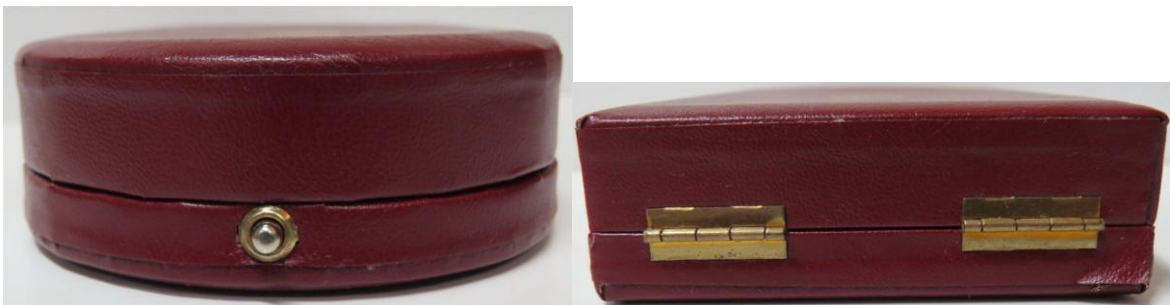
33. kép - A Kiskereszt / Lovagkereszt doboza nyitó gombja az elején és a hátsó oldala