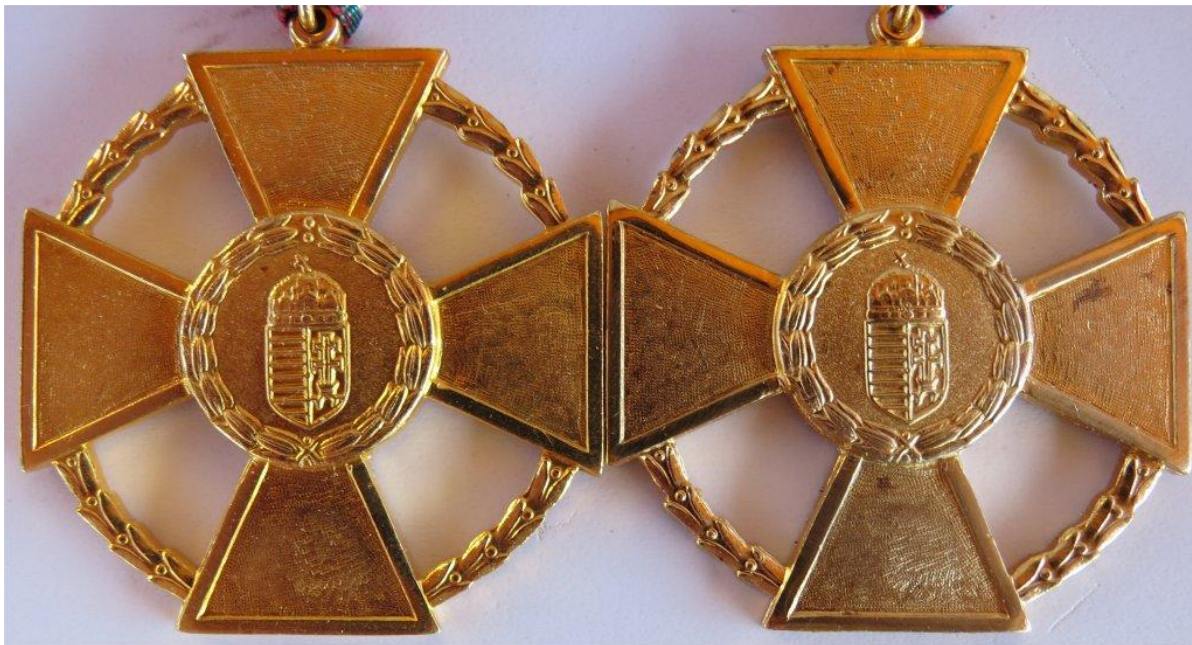
23. – 24. kép - Érdemkeresztek arany fokozat eltérések az éremtest felső oldalán

Az éremtestek felső oldalát vizsgálva látszik, hogy a külső koszorú kivitelezése jól láthatóan eltérő. A köztársasági címer és a körülötte futó koszorú is más - más verőtővel készült.