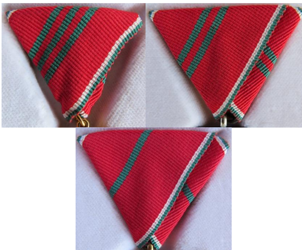
12. – 13. – 14. kép - Érdemkereszt katonai tagozat szalagok: arany, ezüst, bronz

A katonai tagozat szalagján a 34 mm széles piros sávot jobbról-balról 1,5 mm széles fehér és 1,5 mm széles zöld csík szegélyezi; a bronz fokozat szalagjának közepén egy 2 mm széles zöld sáv, az ezüst fokozat szalagján két 2 mm széles zöld sáv, az arany fokozat szalagján három 2 mm széles zöld sáv húzódik.