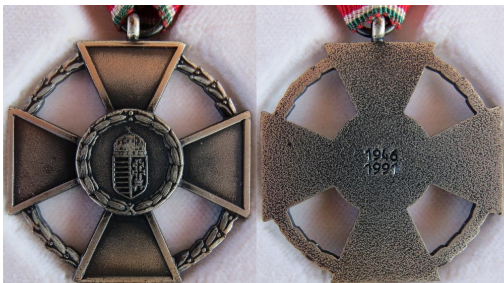
19. – 20. kép - Érdemkereszt katonai tagozat ezüst fokozat éremrész két oldala