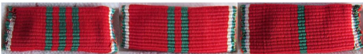
07. – 08. – 09. kép - Az Érdemkeresztek katonai tagozat szalagsávjainak fokozatai szerint: arany, ezüst, bronz.