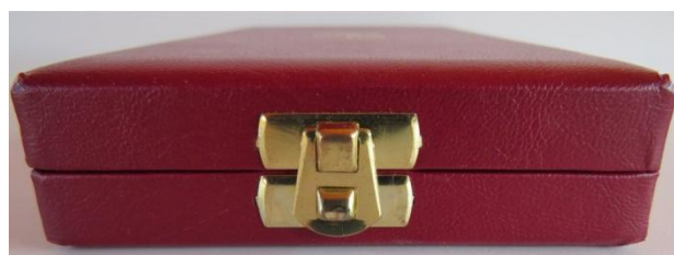
02. kép - felnyitásra - zárásra szolgáló kapocs és a doboz eleje

Az Érdemkeresztek fokozatainak doboza egyforma méretű: 87 mm széles - 146 mm hosszú - 25 mm magas. A felnyitásra-zárásra szolgáló kapocs arany színű. A fedőlapon elhelyezett arany színű címer 40 mm magas - 19 mm széles. A szétnyitáshoz stiftes, fém patentolást alkalmaztak, melynek tüskéi a dobozba vannak ütve.