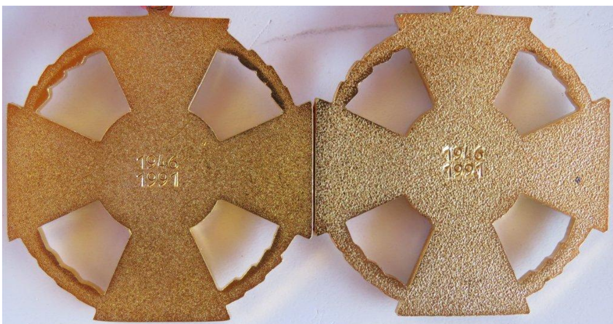
25. – 26. kép - Érdemkeresztek arany fokozat eltérések az éremtest hátsó oldalán

Az éremtestek hátoldalát vizsgálva markáns eltérések láthatóak az anyagokon. Az évszámok karakterei is teljesen eltérőek. A bal oldali külső koszorú "fogasabbnak" / szögletesebbnek látszik, a jobb oldali kerekítettebb.