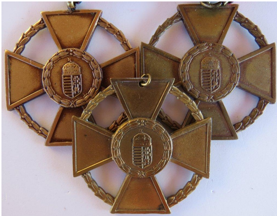
27. kép - Érdemkereszt katonai tagozat bronz fokozatok változatai felső rész

Három különböző bronz fokozat. Az alsónál a legszokatlanabb a furat a kontraszemnek. A tetején nincs forrasztás - illesztés nyoma, eredetileg így készült. Itt is jól megfigyelhetők a külső koszorú, a címer és a belső koszorú kivitelezési eltérések.