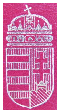
04. – 05. kép - Érdemkereszt doboza felül nézetben, a doboz tetején a címer

A kitüntetés "fészek" érem része 3 mm, a szalag része 4 és 5 mm mély, a szalagsáv szintén 5 mm mély. A szalag és szalagsáv esetében a ruházaton rögzítésre szolgáló tű szerkezet kialakítása miatt mélyül.