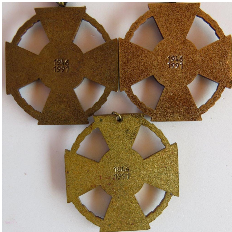
28. kép - Érdemkereszt katonai tagozat bronz fokozatok változatai hátoldal

A vizsgált darabok hátoldalai. Az évszámok karakterei eltérőek, a külső koszorú "fogazatai" mások, az anyagokról nem is beszélve.