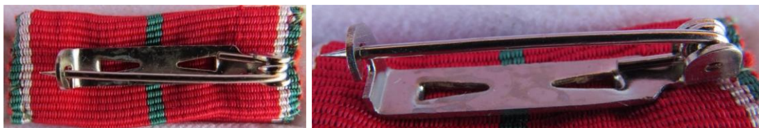
10. – 11. kép - A rögzítésre szolgáló tűs szerkezet tűzős módszerrel.

A katonai tagozat szalagján a 34 mm széles piros sávot jobbról-balról 1,5 mm széles fehér és 1,5 mm széles zöld csík szegélyezi; a bronz fokozat szalagjának közepén egy 2 mm széles zöld sáv, az ezüst fokozat szalagján két 2 mm széles zöld sáv, az arany fokozat szalagján három 2 mm széles zöld sáv húzódik.