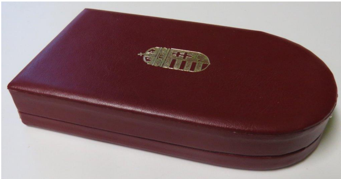
32. kép - A Kiskereszt / Lovagkereszt doboza oldal és felülnézetből