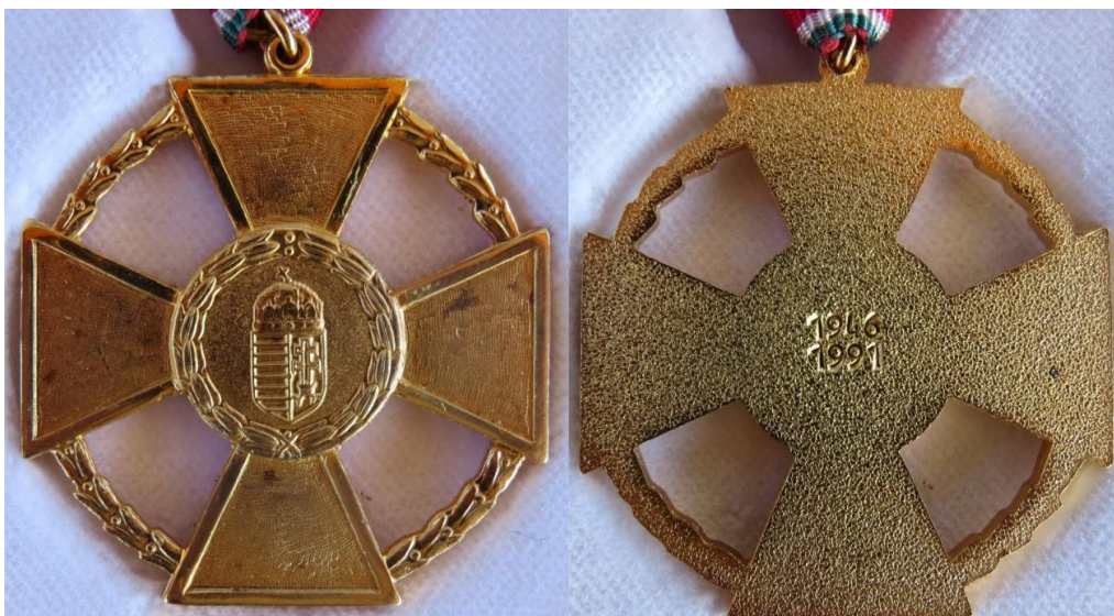
17. – 18. kép - Érdemkereszt katonai tagozat arany fokozat éremrész két oldala