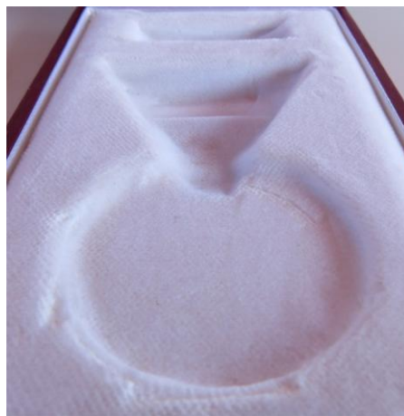
06. kép - A kitüntetés "fészek", felül a szalag tartó rész