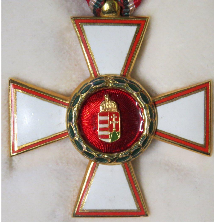
37. kép - Magyar Köztársasági Érdemrend Kiskereszt / Lovagkereszt éremtest felső oldala