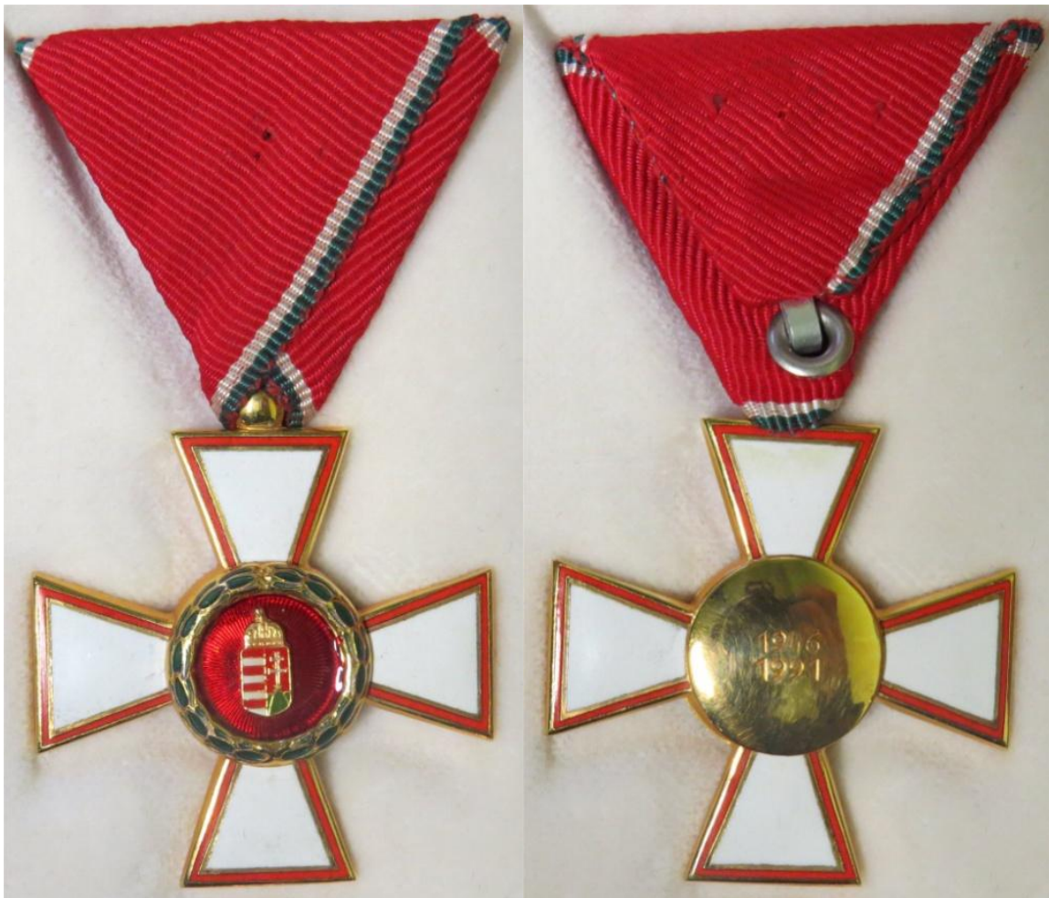
35. – 36. kép - Magyar Köztársasági Érdemrend Kiskereszt / Lovagkereszt egész alakban

A kereszttek szárjai 16 mm szélesek, a babérkoszorú külső átmérője 18 mm. A címer 5 mm széles, 10 mm magas. A kereszt tetején a kontraszem befogadó része látható. A kereszt hátoldalán 18 mm arany domborított lap, melyen "1946 1991" évszámok szerepelnek, a karakterek magassága 2 mm, hosszúsága 6 mm.