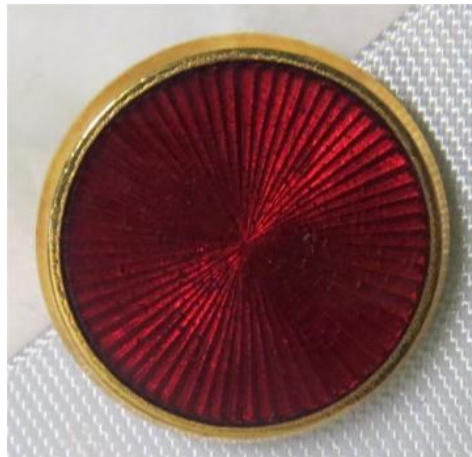
40. kép - Magyar Köztársasági Érdemrend Kiskereszt / Lovagkereszt rozettája (gomblyuk jelvény)

A rozetta (gomblyuk jelvény) prizmás kivitelezésű, 15 mm átmérőjű. A keret foglalata arany színű, 1 mm széles és 2 mm vastag. Hátoldala tús kivitelű, sima felületű. Kizárólag a zakó, öltöny vagy szmoking bal oldali hajtókájának gomblyukába tűzve szabad viselni.