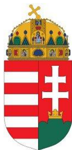
01. kép - Magyar Köztársaság címere 1989. október 23.-tól

Mivel az államforma Köztársaság lett, így a királyság és a monarchia szimbólum és jelképrendszerének átvétele nem jöhetett teljes mértékben szóba, de egy kicsit mégis. Az államcímér a koronás kiscímér lett, amely az 1867-es kiegyezést követően volt 1890-ig Magyarország hivatalos címere.