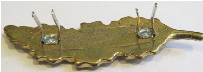
09. kép - A tölgyfalom hátulja félig oldalnézetből.

A gallérhoz rögzítő fülek forrasztott rögzítésűek, a tölgyfalomb testbe vésett befogadó téglalap 5 X 4 mm alapterületű.