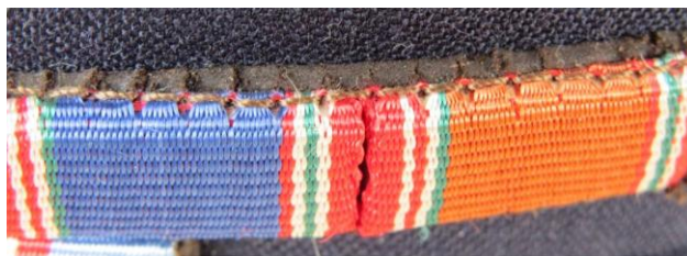
16. kép - A szalagsávok varrással történt rögzítése a barna háttéranyagra

Érdekes továbbá a szalagsávok egyenkénti rögzítési módja. A kemény hátlapra a két szűrő nyelv mellett cérnával történő körbevarrást is találunk, huroköltéssel. Nagyon közelről látható, hogy a huroköltés miatt a szalagsáv anyaga kissé sem esztétikusan deformálódik.