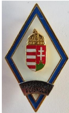
14. kép - Rendőrtiszti Főiskola végzettségi jelvény, 1990-től

mm-es sávban aranyozott foglalatban kék szín határolja. Közepén 20 mm-es átmérőjű zománcozott vörös csillag, rajta a Magyar Népköztársaság címere. A vörös csillag alatt ezüstös körgyűrűszeletben „Rendőrtiszti Főiskola” felirat bevésve.”. A népköztársasági címer lett 1989. október 23.-a után lecserélve a köztársasági címerre.