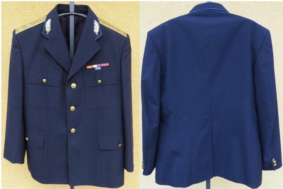
02. – 03. kép - A zubbony előlnézetből és hátul nézetből

A zubbony egysoros gombolású, tropikál anyagú, 1957M fazonú, nyitott galléros kivitelezésű. Azért is jelöltem 1957M fazonúnak, mert ezt akkor vezetik be és azóta sem változott,