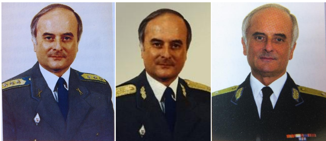
11. – 12. – 13. kép - Portréfotók: 1998-ban ezredes majd dandártábornok, 2004-ben vezérőrnagy

Nagyon érdekes, hogy a dandártábornoki kinevezésekor készült képen a galléron lévő tölgyfalombok alatt egyáltalán nem látszik a világoskék posztóalátét. A jobb zsebfedő felett viseli a Rendőrtiszti Főiskola, rombusz alakú végzettségi jelvényt (1990 utáni típust). Nem viseli viszont a tábornoki zubbonyon a szalagsáv sorsort a bal zsebfedő felett. Nem viselte korábban sem, ez az 1998-ban készült ezredesi portrén is látszik. A végzettségi jelvény viszont látható a jobb zsebfedő felett. A 2004-ben ORFK Vezetőjeként készült hivatalos fotón a jobb zsebfedő felett nincs felhelyezve a végzettségi jelvény, a bal zsebfedő felett textil szalagsáv sor látható. Érdekes továbbá, hogy a felsőfokú (egyetemi) végzettségi jelvényt sem viseli egyik egyenruháján sem.