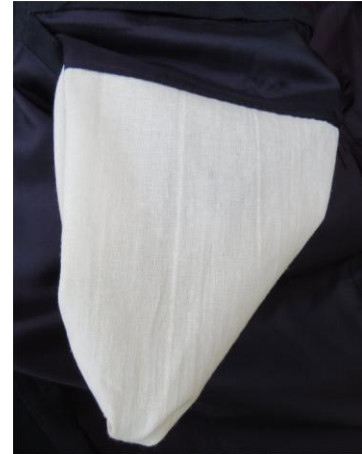
27. – 28. kép - A zubbony belső részlete és a zsebek belsejében a fehér vászonszerű anyag