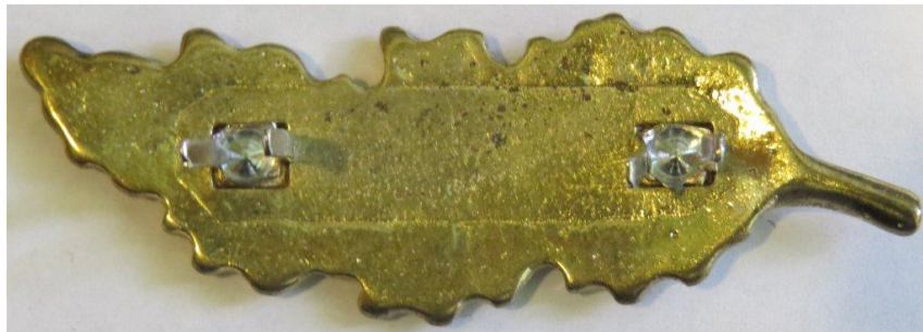
08. kép - A tölgyfalomb hátulja felülnézetből

A tölgyfalomb rögzítő fül hosszúsága 12 mm, szélessége 2 mm, vastagsága 1 mm. A páros rögzítő fül közötti távolság 5 mm (külső oldalukról mérve), a két páros rögzítő belső fülek közötti távolság 23 mm.