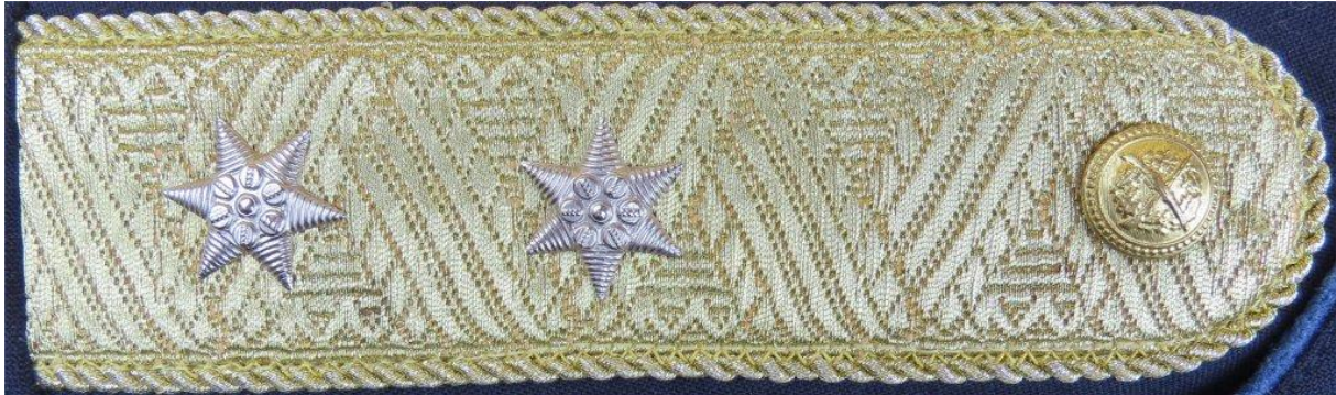
29. kép - A vezérőrnagyi rendfokozatú jobb vállon lévő vállszalag

A tábornoki vállszalag fémszálas aranyzsinórral szegélyezett, egyik vége félkör alakban lekerekített. A zsinór vonalát követve 35 mm-es arany paszomány van rátűzve.