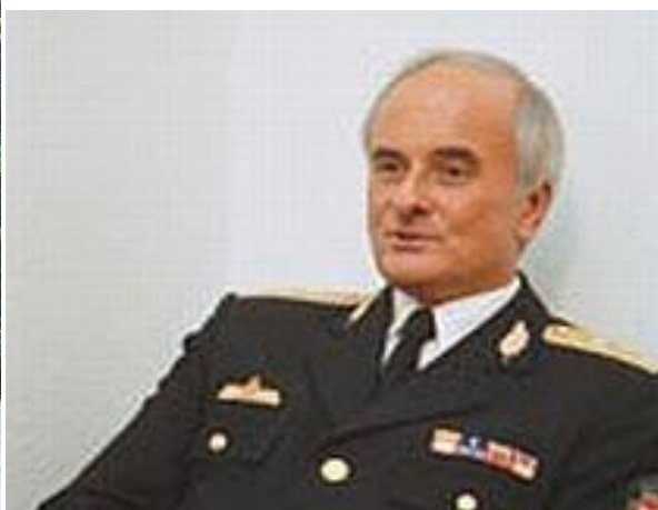
17. – 18. kép - dr. Bene László rendőr altábornagy 2005-ben és 2006-ban