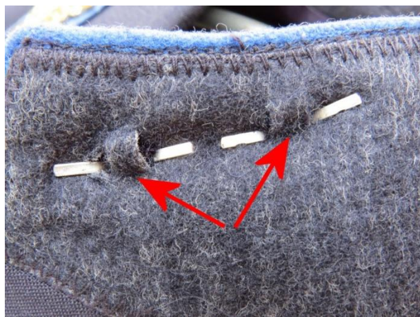
04. - 05. kép - A fém tölgyfalevél a világoskék posztóalátéttel a galléron, a tölgyfalevél rögzítése a galléron, a paszpólozás