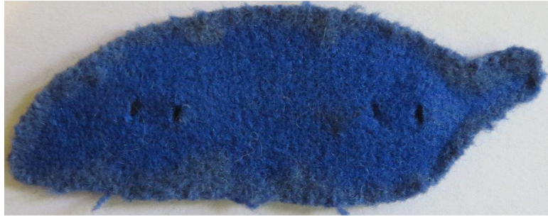
07. kép - A tölgyfalomb kék színű posztó alátéte, látszanak a rögzítő fülek átszúrás nyomai. A szegély részen koszolódás látszik.

A tölgyfalomb rögzítő fül hosszúsága 12 mm, szélessége 2 mm, vastagsága 1 mm. A páros rögzítő fül közötti távolság 5 mm (külső oldalukról mérve), a két páros rögzítő belső fülek közötti távolság 23 mm.