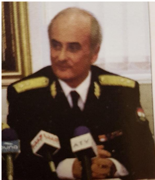
37. kép - A 2005. április 19-n készült Fóton, a Károlyi Kastélyban.