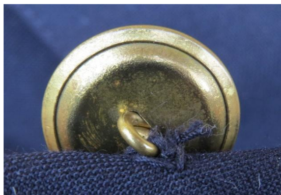
21. – 22. kép - A 23 mm átmérőjű gomb (nagy) és rögzítése a zubbonyon