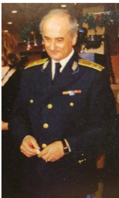
35. kép - A 2004. december 19.-n készült képen, a Rendőrségi Igazgatási Központban a "Nagycsaládosok Karácsonyi Ünnepségén".