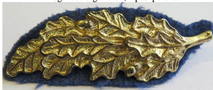
06. kép - arany színű, fém tölgyfalomb a világoskék posztó alátéttel