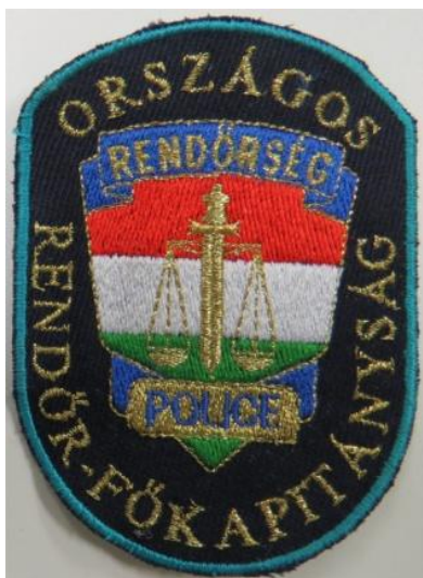
20. kép - Országos Rendőr-főkapitányság karjelvénye, 1992-es típus