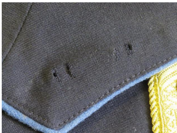
10. kép - A galléron lévő lyukak a rögzítő füleknek

A szalagsáv sorazonosításnál ismerni kell az adott személy pályafutását is, hogy az adott időben milyen kitüntetésekkel rendelkezett. Az öltözködési szabályokat rögzítő belügyminiszteri utasítás és az ORFK norma szerint – követve a korábbi, 1989 előtti szabályozókat – egy sorban négy kitüntetés szalag lehet. A szalagsáv sorsort – sorokat úgy kell felhelyezni a bal zsebfedő fölé, hogy a zseb gombja a mértani középpontja a szalagsáv sornak.