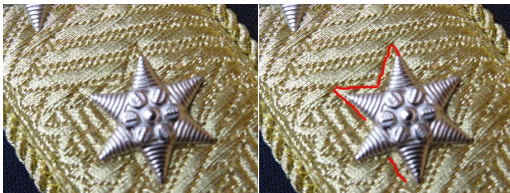
32. – 33. kép - A 25 mm-es csillag helyének lenyomata a bal oldali vállszalagon

A vállszalagok szélességének és a csillagok nagyságának arányait figyelembe véve a képek alapján megállapítható, hogy dr. Bene László rendfokozati jelzésein kisebb csillagok vannak mint kellene. A csillagok közötti távolság arányaiban ugyanazt mutatja a fotókon mint a vizsgált zubbonyon.