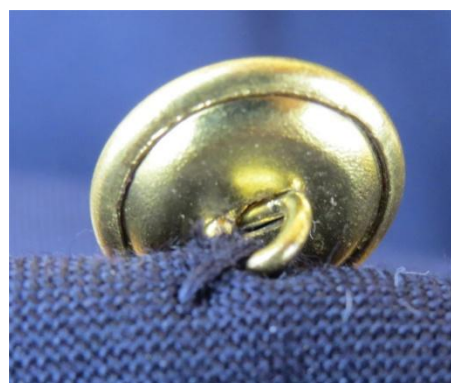
23. – 24. kép - A 15 mm átmérőjű gomb (kis) és rögzítése a zubbonyon

A zsebek kialakítása szintén szokványos. A zsebfedő felső része selyem anyaggal borított, a zseb felső széle szintén selyem anyaggal szegélyezett